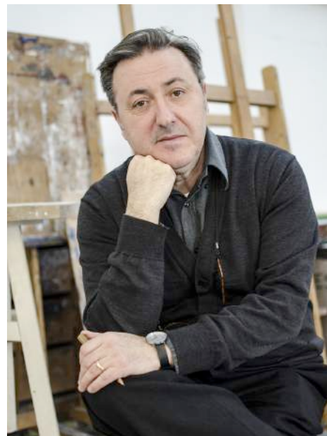
Giuseppe Caccavale