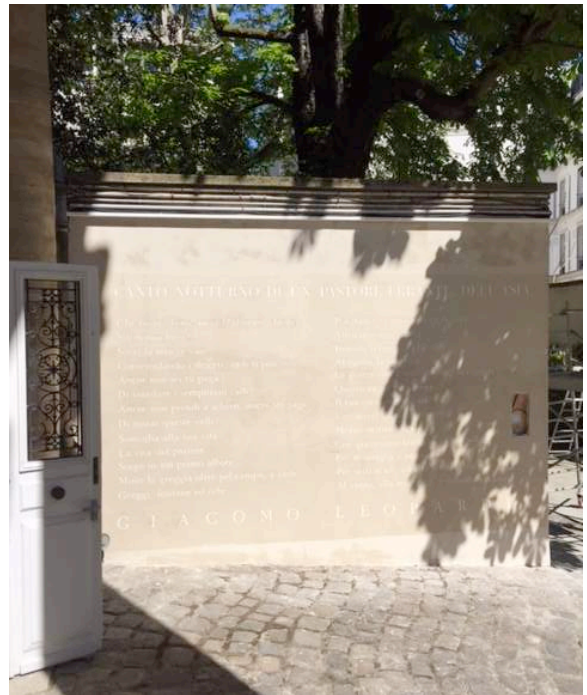
Institut Culturel Italien de Paris

À partir du 26 mai, les vers du célèbre poème de Giacomo Leopardi, Canto notturno di un pastore errante dell'Asia , et quatre compositions lyriques des poètes Alfonso Gatto, Leonardo Sinisgalli, Lorenzo Calogero et Bartolo Cattafi seront gravés sur le mur de l'Hôtel Galliffet, qui côtoie l'entrée sur la rue de Grenelle. Giuseppe Caccavale réalisera cette œuvre d'art en collaboration avec ses anciens élèves de l'École Nationale Supérieure des Arts Décoratifs de Paris, en employant l'ancienne technique d'art mural du « spolvero ». Exceptionnellement, il utilisera pour l'occasion les caractères Tallone dessinés par l'éditeur Alberto Tallone, gravés à la main par Charles Malin à Paris et fondus par Radiguer. Dotation exclusive de la Maison d'Édition Tallone, elle a été concédée par Enrico Tallone à l'Institut pour le Viale dei Canti, en tant que symbol du style italien et trait-d'union entre l'Italie et la France. Ce caractère, dans ces formes, tend à résumer tous les grands classiques, depuis le Garamond et le Fournier, jusqu'au Bodoni et au Didot. À travers ce caractère, Alberto Tallone voulut créer un Elzévir privé de toute fioriture, qui donnât des pages blondes, unies, où rien ne fit distraire l'œil entre le signe et la pensée des grands écrivains.