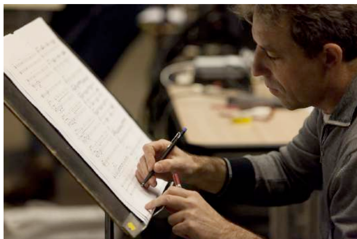
Stefano Gervasoni

La production de Stefano Gervasoni (né à Bergame, Italie, en 1962) est marquée par une expression délicate au lyrisme fragile, évoluant dans un monde sonore riche et raffiné. La transparence de son écriture est constamment voilée par des processus à peine perceptibles, qui viennent progressivement altérer de l'intérieur l'image sonore initiale. Il fait appel à une large palette d'éléments de langage : structures modales, accords parfaits, éléments bruités et une grande variété de modes de jeu. Stefano Gervasoni étudie la composition au Conservatoire de Milan avec Luca Lombardi, Niccolò Castiglioni et Azio Corghi. Ses rencontres avec Brian Ferneyhough, Peter Eötvös et Helmut Lachenmann, mais aussi Gerard Grisey et Heinz Holliger seront déterminantes dans son parcours. Il reçoit des commandes de l'Ensemble Intercontemporain, du festival Archipel de Genève, de Contrechamps, de Klangforum Wien, du Festival d'Automne à Paris, de Radio France, du WDR, du Teatro alla Scala de Milano, du Suntory Hall de Tokyo, de la Berliner Biennale... Pensionnaire de la Villa Medici (1995-96), boursier de la Fondation des Treilles à Paris (1994) et du DAAD à Berlin (2006), compositeur en résidence au Domaine de Kerguéhennec de 2008 à 2010, il enseigne la composition au CNSMDP de Paris depuis 2006.