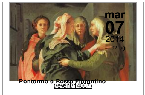
Pontorno e Rosso Fiorentino ( event/14567 )