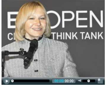
BE OPEN. Una finestra globale sulla creatività. A Milano, in occasione della Design Week